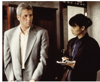
1997 RED CORNER (Red Corner) de Jon Avnet avec Bai Ling