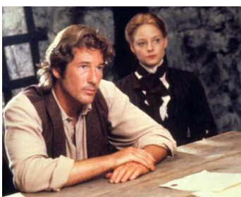
1993 SOMMERSBY (Sommersby) de Jon Amiel avec Jodie Foster