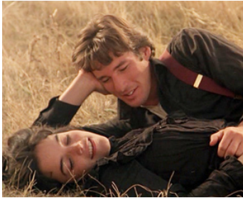
1979 LES MOISSONS DU CIEL (Days of Heaven) de Terrence Malick avec Brooke Adams