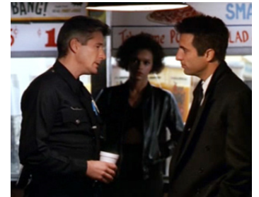
1990 AFFAIRES PRIVÉES (Internal Affairs) de Mike Figgis avec Andy Garcia