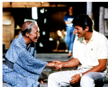
1991 RHAPSODIE EN AOÛT (Hachigatsu no kyoshikyoku) d' Akira Kurosawa