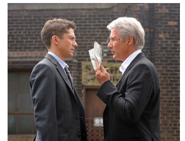
2011 SECRET IDENTITY (The Double) de Michael Brandt avec Topher Grace