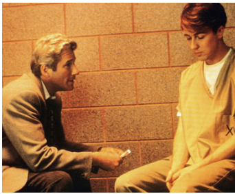
1996 PEUR PRIMALE (Primal Fear) de Gregory Hoblit avec Edward Norton