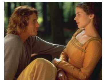
1995 LANCELOT, LE PREMIER CHEVALIER (First Knight) de Jerry Zucker avec Julia Ormond