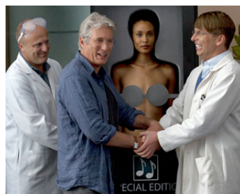
2013 MY MOVIE PROJECT (Movie 43) de Steven Brill et Peter Farrelly avec Halle Berry