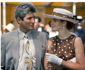
1990 PRETTY WOMAN (Pretty Woman) de Garry Marshall avec Julia Roberts