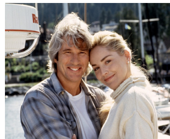
1994 INTERSECTION (Intersection) de Mark Rydell avec Sharon Stone