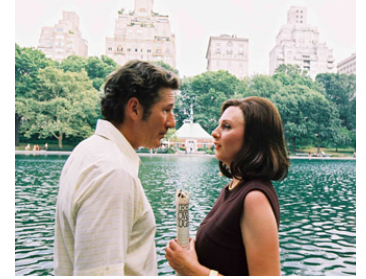
2006 FAUSSAIRE (The Hoax) de Lasse Hallström avec Julie Delpy