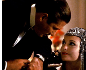
1984 COTTON CLUB (Cotton Club) de Francis Ford Coppola avec Diane Lane