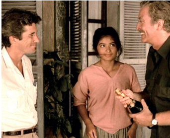
1983 LE CONSUL HONORAIRE (The Honorary Consul) de John Mackenzie avec Michael Caine