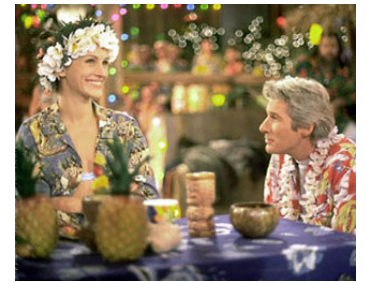
1999 JUST MARRIED (OU PRESQUE) (Runaway Bride) de Garry Marshall avec Julia Roberts