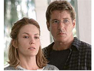
2002 INFIDÈLE (Unfaithful) d'Adrian Lyne avec Diane Lane