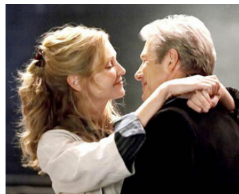
2009 HATCHKI (Hatchkô, a Dog's Story) de Lasse Hallström avec Joan Allen