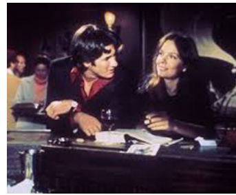
1977 À LA RECHERCHE DE MR GOODBAR (Looking for Mr Goodbar) de R. Brooks avec Diane Keaton