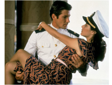
1982 OFFICIER ET GENTLEMAN (Officer and Gentleman) de T. Hackford avec Debra Winger