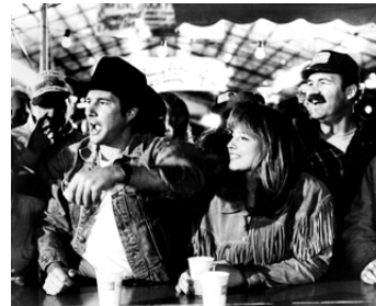
1988 RIEN À PERDRE (Miles from home) de Gary Sinise avec Helen Hunt