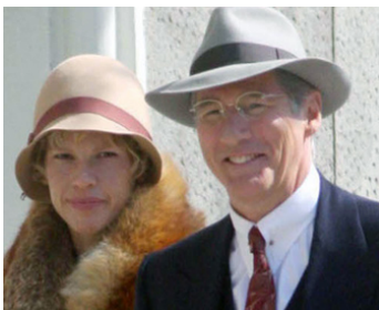
2009 AMELIA (Amelia) de Mira Nair avec Hilary Swank