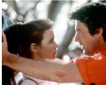
1983 À BOUT DE SOUFFLE, MADE IN USA (Breathless) de Jim McBride avec V. Kaprisky