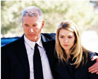
2007 THE FLOCK (The Flock) d'Andrew Lau avec Claire Danes