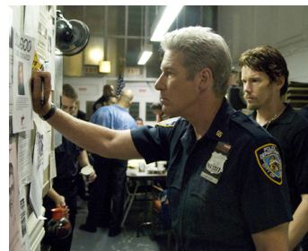
2010 L'ÉLITE DE BROOKLYN (Brooklyn's Finest) d'Antoine Fuqua avec Ethan Hawke