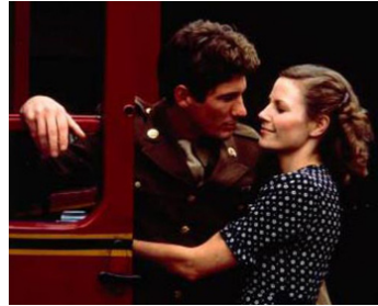
1979 YANKS (Yanks) de John Schlesinger avec Lisa Eichhorn