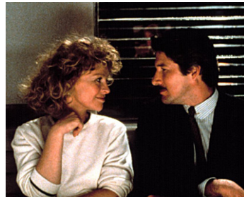
1986 LES COULISSSES DU POUVOIR (Power) de Sidney Lumet avec Julie Christie