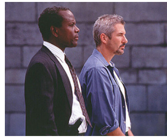
1997 LE CHACAL (The Jackal) de Michael Catton-Jones avec Sidney Poitier