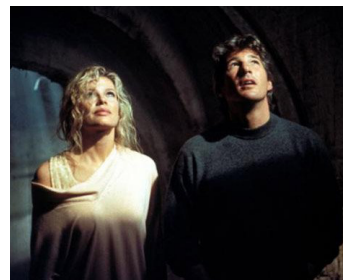
1992 SANG CHAUD POUR MEURTRE DE SANG-FROID (Final Analysis) de P. Joanou avec Kim Basinger