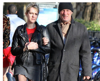
2014 TIME OUT OF MIND d'Oren Moverman avec Jena Malone