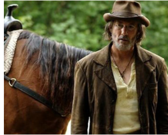
2007 I'M NOT THERE (I'm not there) de Todd Haynes