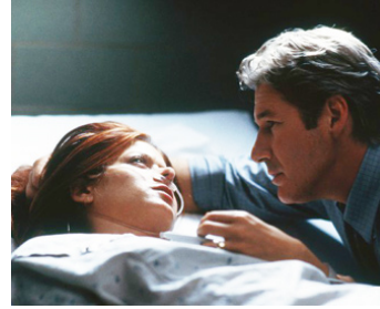
2002 LA PROPHÉTIE DES OMBRES (The Mothman Prophecies) de M.Pellington avec Debra Messing