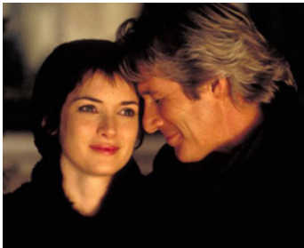
2000 UN AUTOMNE À NEW YORK (Autumn in New York) de Joan Chen avec Winona Ryder