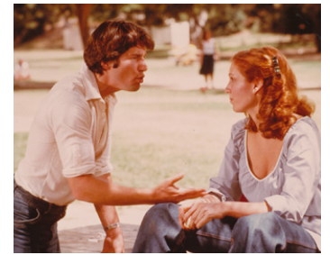
1978 LES CHAÎNES DU SANG (Bloodbrothers) de Robert Mulligan avec Marilu Henner