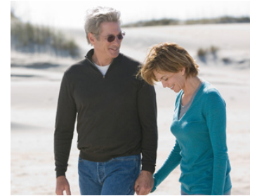
2007 NOS NUITS À RODANTHE (Nights in Rodanthe) de George C. Wolfe avec Diane Lane