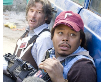
2007 THE HUNTING PARTY (The Hunting Party) de Richard Shepard avec Terrence Howard