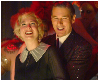
2003 CHICAGO (Chicago) de Rob Marshall avec Renée Zellweger