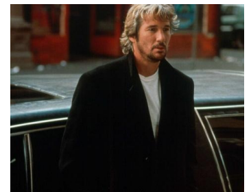
1993 LES SOLDATS DE L'ESPÉRANCE (And the Band played on) de Roger Spottiswoode