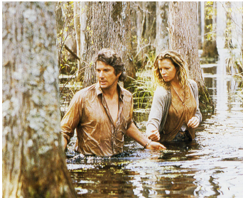
1986 SANS PITIÉ (No Mercy) de Richard Pearce avec Kim Basinger