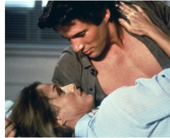
1980 AMERICAN GIGOLO (American Gigolo) de Paul Schrader avec Lauren Hutton