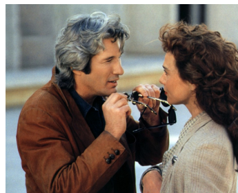
1993 MISTER JONES (Mr Jones) de Mike Figgis avec Lena Olin